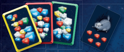
55 двусторонних карточек