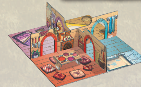
1 поле с комнатами (включая стены и 3D-элементы)