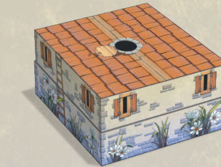
1 коробка с мышиным домом