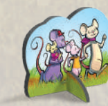
1 фишка с мышами