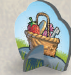
1 фишка с корзинкой