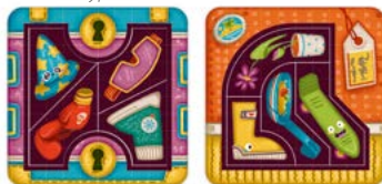
Рис. 2. Уровни сложности чемоданов.