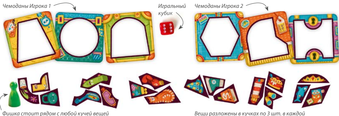
Рис. 3. Первоначальная раскладка.

Подготовка к игре: раздайте игрокам по 3 чемодана . В центре стола разложите случайные вещи (не нужно специально отбирать те, что из чемоданов игроков) в кучки, по 3 вещи в каждой. Всего вещей должно быть в три раза больше, чем участвующих в игре чемоданов. Например, при игре вдвоём, понадобится 6 чемоданов и 18 вещей (рис. 3). Рядом с любой кучкой вещей поставьте фишку, в центре стола положите кубик.